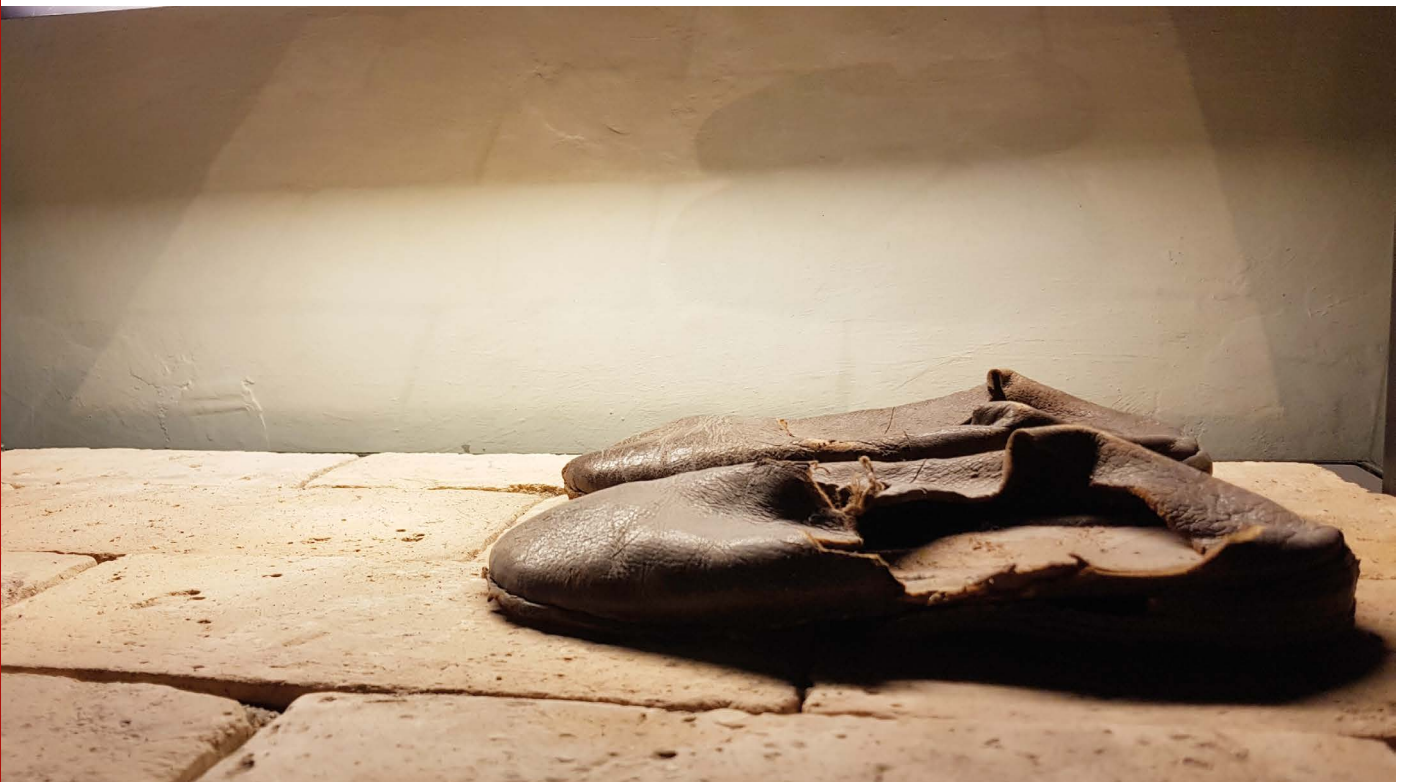
Scarpe di sant'Ignazio di Loyola custodite nelle stanze del santo (Chiesa del Santissimo Nome di Gesù all'Argentina, Roma)

Ho pregato fissando quelle scarpe, ricordandomi anche quelle di S. Ignazio che sono conservate nelle "Camerette" alla Chiesa del Gesù. Quelle scarpe usurate, mantenute fino all'ultimo, rappresentano il messaggio di una Chiesa povera, una Chiesa dei poveri, una Chiesa con i poveri. Ma anche di un pellegrino che ha consumato le sue scarpe camminando fino alle periferie del mondo. La Chiesa di cui il mondo ha bisogno. ●