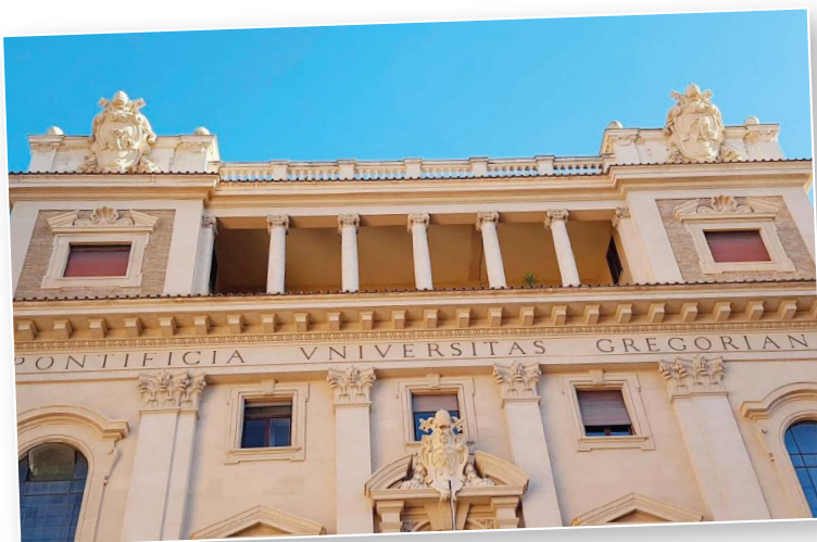
Pontificia Università Gregoriana (Roma)

Due versanti che coinvolgono intenzionalità e impegno, una formazione critica e una convinta azione sociale: scegliere un tempo di ricapitolazione della vita e aggiornamento come quello offerto nel programma di leadership e management che da anni portiamo avanti alla Gregoriana e legare la propria opzione per la giustizia sociale, la pace, l'impegno solidale e volontario nel Magis.